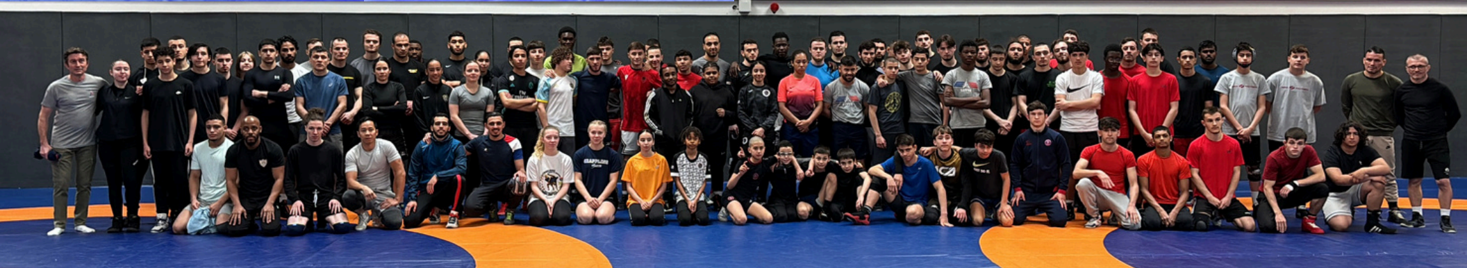
Partenaires du Comité régional d'Île-de-France de lutte et disciplines associées