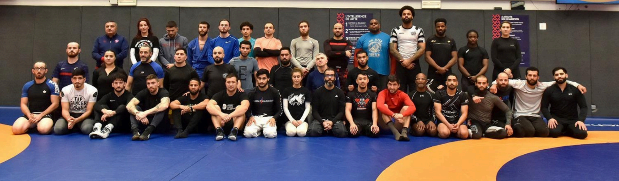
Partenaires du Comité régional d'Île-de-France de lutte et disciplines associées