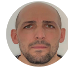
SAHRIDJ Nassime Formations et Luttes contre les faits religieux et violences