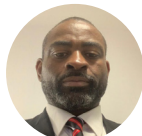
MANGA Benjamin Développement Disciplines As- sociées et Pratiques Féminines